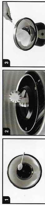
Geben Sie Zucker in den Abzugbehälter.